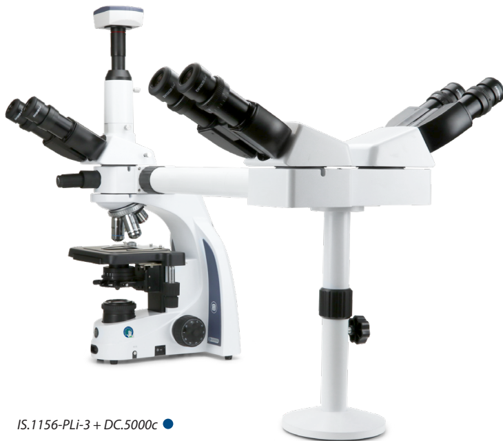
IS.1156-PLi-3 + DC.5000c ●