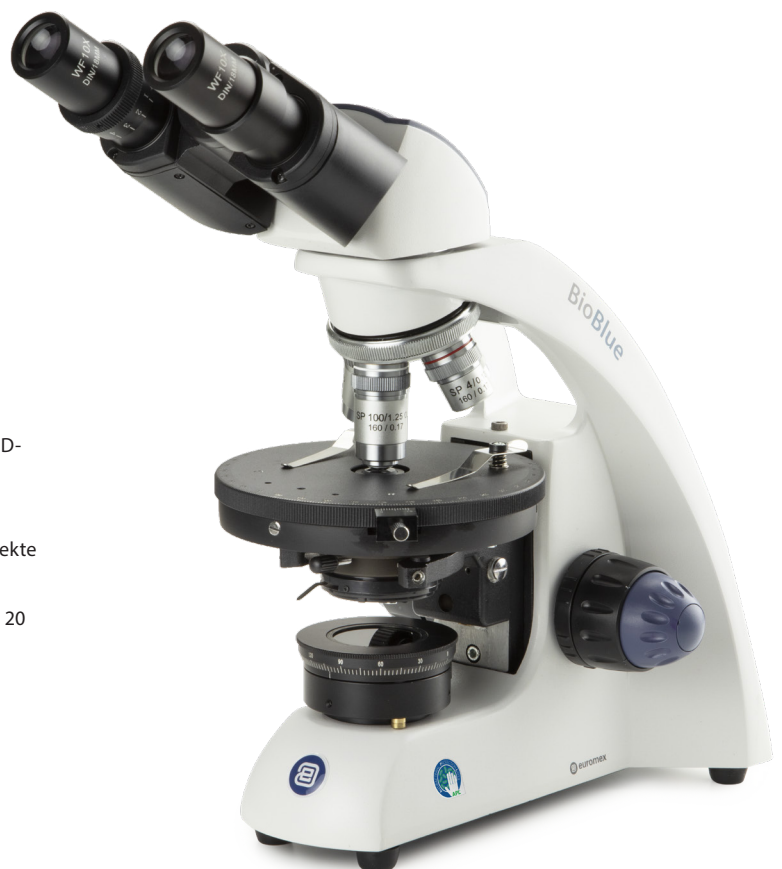
● Polarisation-Modell BB.4260-P-HLED

APL (Anti-bacterial Protection Layer) ist eine revolutionäre Farbbehandlung für die kritischsten Teile unserer Produkte. Ein Mikroskop mit APL schränkt den Wachstum von Mikroorganismen, einschließlich Bakterien und Schimmelpilzen deutlich ein