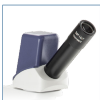
Digital Monokularer Kopf