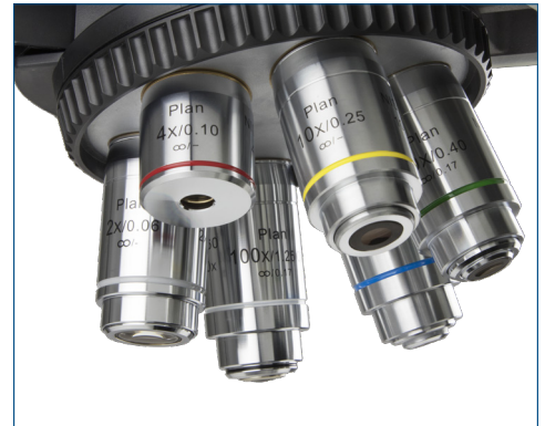
Sextuple nosepiece ●

Objetivos opcionales: Objetivo Plano acromático 2x/0.06 (distancia de trabajo