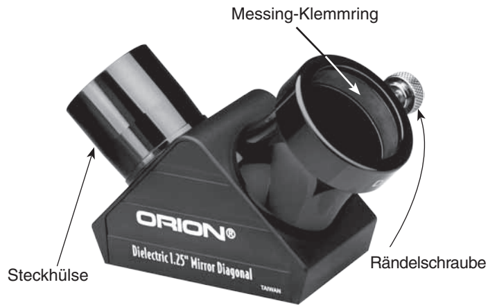
Der Orion 1,25-Zoll-Zenitspiegel mit hohem Reflexionsgrad

Außergewöhnliche optische Produkte für Endverbraucher seit 1975